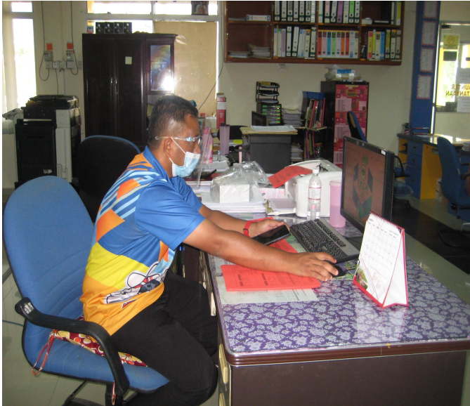
(Pada 1/3/2023 penggal pertama)