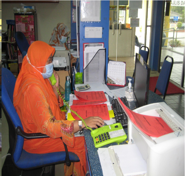
(Pada 1/9/2023 penggal kedua)