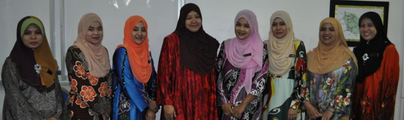
Antara Peserta Taklimat 'MDM Menuju EKSA '